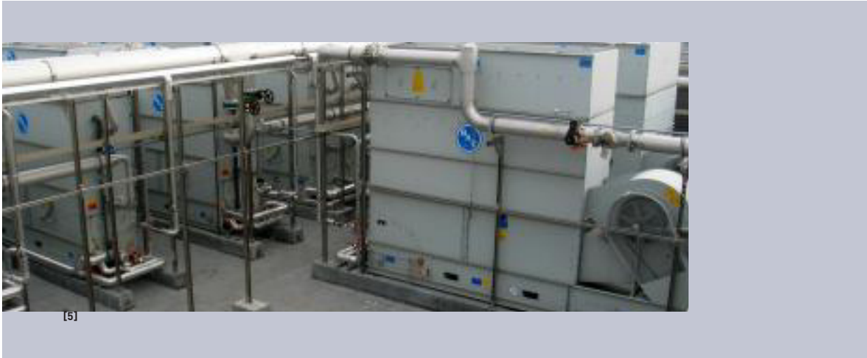
[5] Die umfangreiche Rückkühlanlage auf dem Turmdach.

sung im Kastenfenster wird die Transmission von Kälte bzw. Wärme im Sommer bzw. Winter massgeblich verhindert. Die innere Oberflächentemperatur der Fenster ist ähnlich der Raumtemperatur, was eine hohe Behaglichkeit garantiert.